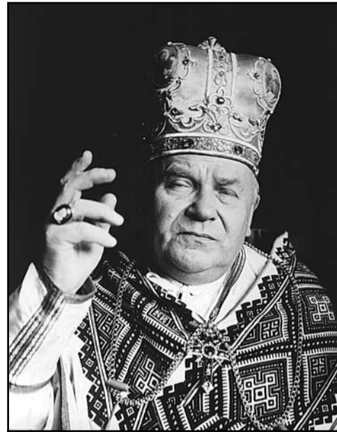
• Ёго Преосвященство, благореченый єпископ-мученик, Русин – Василь Гопко.

Наконець впали слова крітики і на позицію духовных справців пряшівской епархії, котры наперек тому, же дістали інформацію о презентації фільмовых документів о Русинах і позванку на акцію, не інформовали о ній своїх віруючих. Компетентны бы ся мали над тым задумати і в будучности змінити свое одношіня к тым ділам. П. К., Пряшів