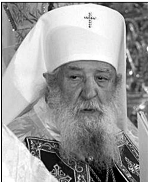
• Ёго Высокопреосвященство Лавр (Русин – Василь Шкурла), глава Російской православной заграничной церкви, митрополита выходо-американцкый і ньюйорскый.

Може не є на выходї Словакії хыжы, з котрой бы ся дахто не выстагвал за море, до чужіх і далеких країв. Лем з нашой, соломов прикритої і з глинянов підлогов, деревяніці з Ладомировой (окрес Свідник) одышло до Америки аж пятеро людей: мої три теты, тогды молоды дівчата, стрыко і старшый брат Василь, пізнішый митрополита Лавр, высокый церковный ерарха.